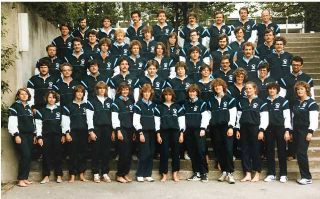
«Gesamtverein» Sportverein Olten»