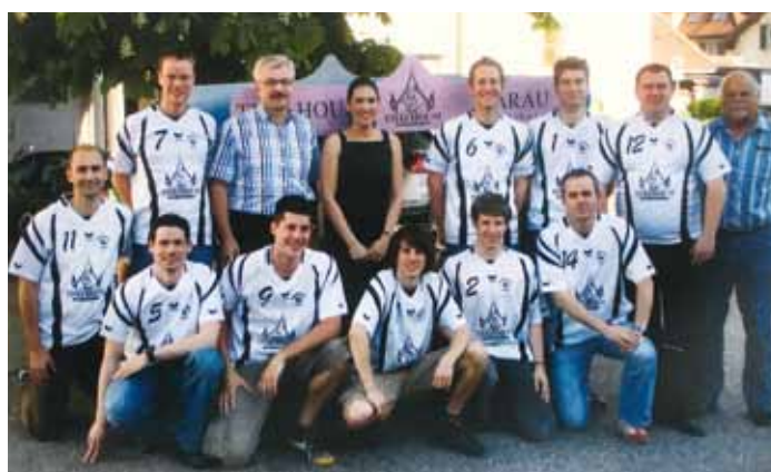
Thai House Dresssponsor Volleyballteam