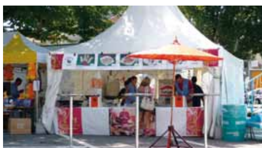
Thai House an der Kilbi