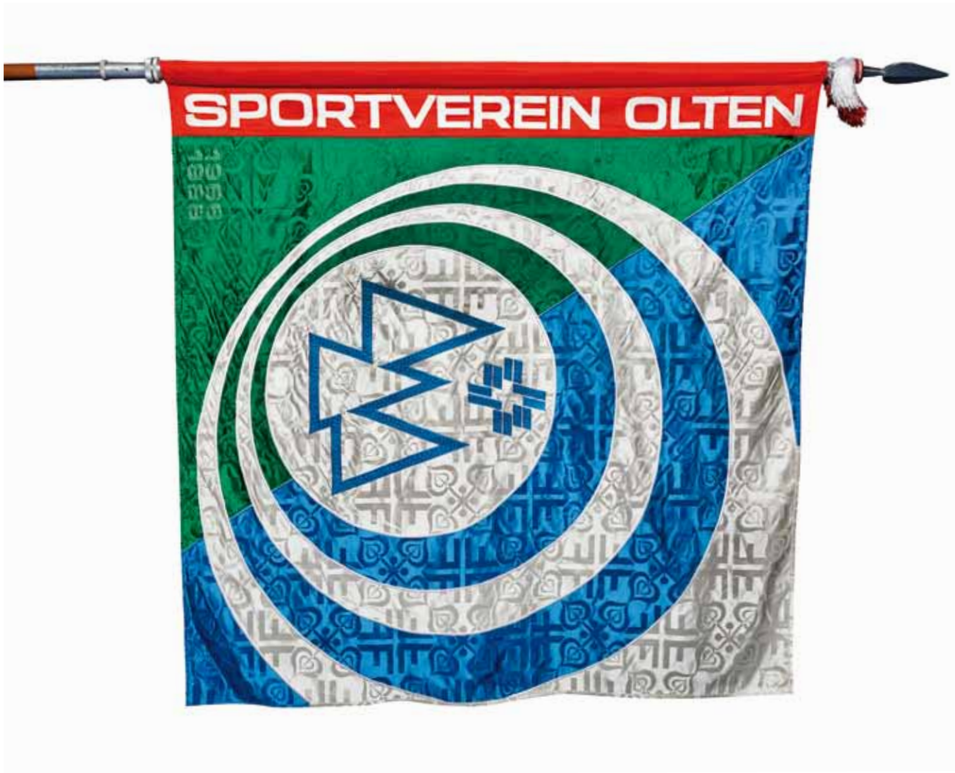
1. Vereinsfahne des STV Sportverein Olten, 1986