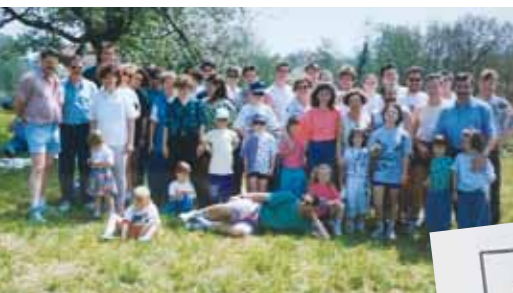
Ausflug Schnottwil, Kantonaler Wandertag