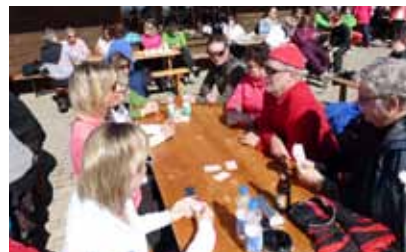
... eine Jass-Riege