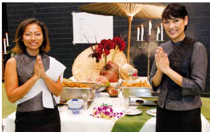
Thai House an den SVOlten Helferhöck's