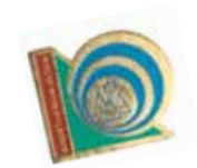
2. Vereins-Pin ab 1982