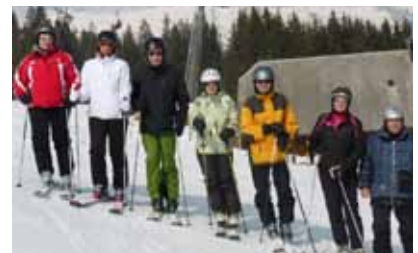
... eine Ski-Riege