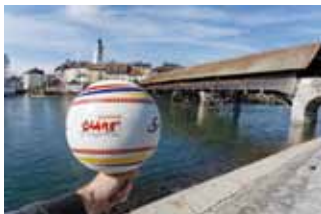
3. EM 2014 in Olten

Der Sportverein Olten hat in seiner Geschichte kurz nach seiner Gründung im Jahre 1970 die erste Faustball-Europameisterschaft in Olten durchgeführt. Die zweite Europameisterschaft richtete der Verein im Jahre 1991 aus. Danach folgte die euro'2014, die der Sportverein zusammen mit dem Turnverein durchgeführt hat.