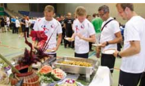
Thai House an der «faustball euro'14»