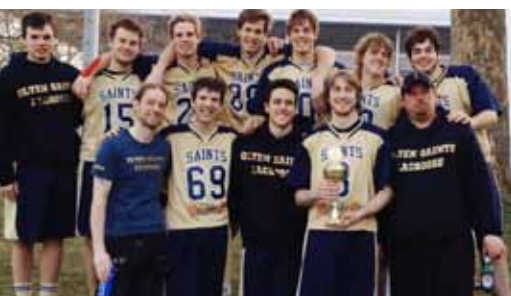
Lacrosse-Team, 3. Platz am BäreCup