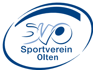
2016... Hauptverein-Logo und die Logos der fünf Riegen Design > Bruno Castellani, Starrkirch-Wil