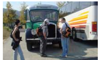
... eine Ausflugs-/Reise-Riege