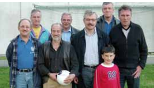
Siegerteam des traditionellen Faustballturniers in Niedergösgen