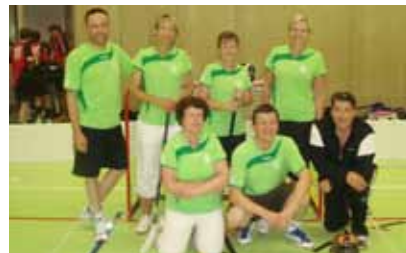
wir sind auch eine Spiel-Riege