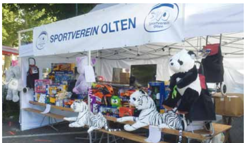
SV Olten Tombola an der Oltner Kilbi – immer dabei!