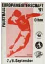
2. EM 1991 in Olten