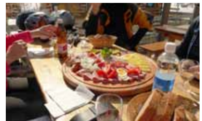
... eine Genuss-Riege