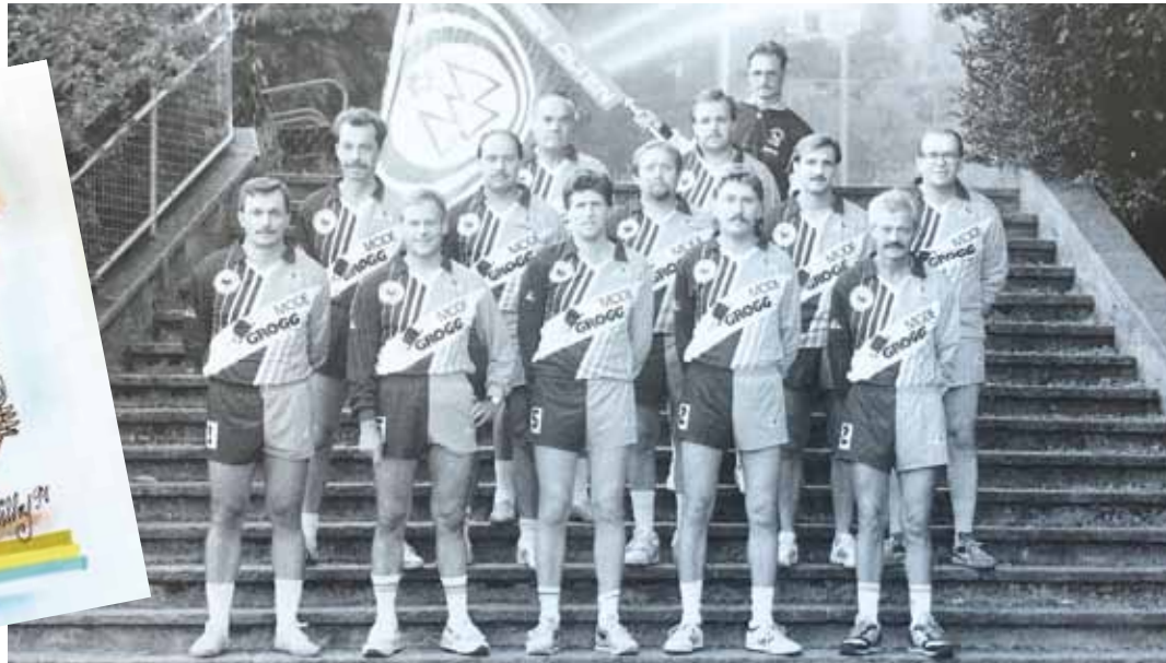
Faustball-Riege Sportverein Olten