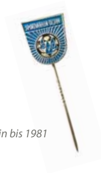
1. Vereins-Pin bis 1981