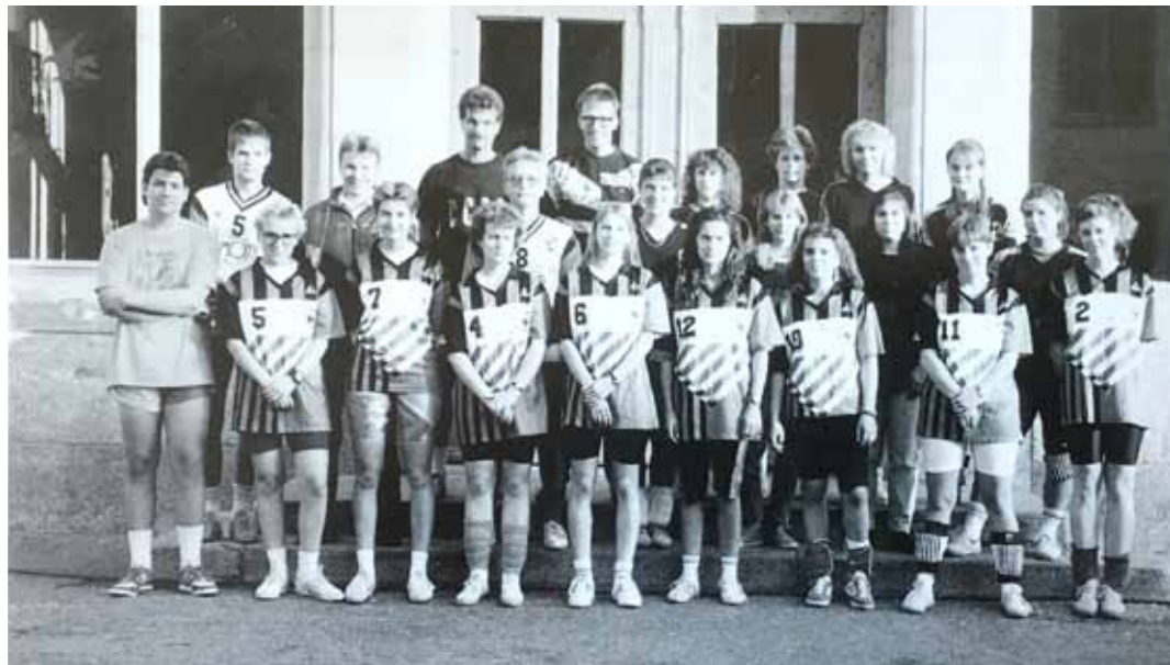
Volleyball-Riege Sportverein Olten

Titelseite Festschrift «25 Jahre Sportverein Olten 1966–1991» Verfasser, Armin Kunz, Olten Gestaltung, Alban Würgler, Fülenbach Druck, Linus Dobler Jun., Olten