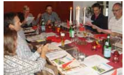
... eine Fest-Riege