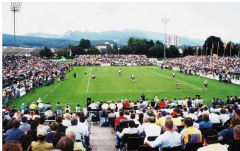
8000 Zuschauer am WM-Finalspiel Deutschland – Brasilien, im Stadion Kleinholz in Olten