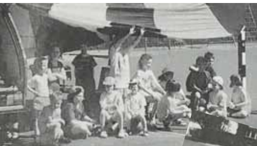
Szenen vom Polysportanlass