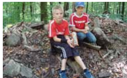
... eine Wander-Riege