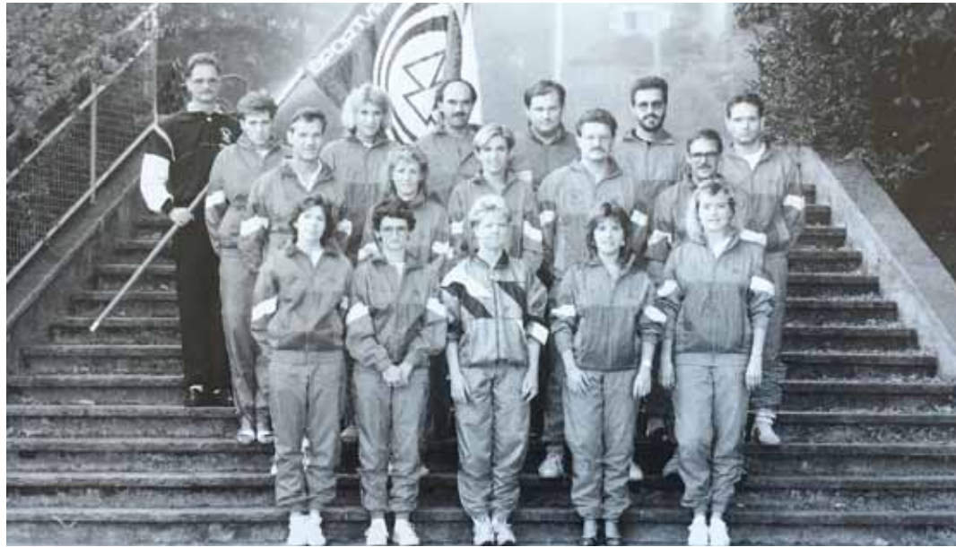
Fitness-Riege Sportverein Olten