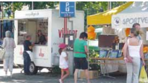
Kiosk-Verkaufsstand an der Kilbi