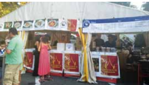
Thai-Food am Schulfest