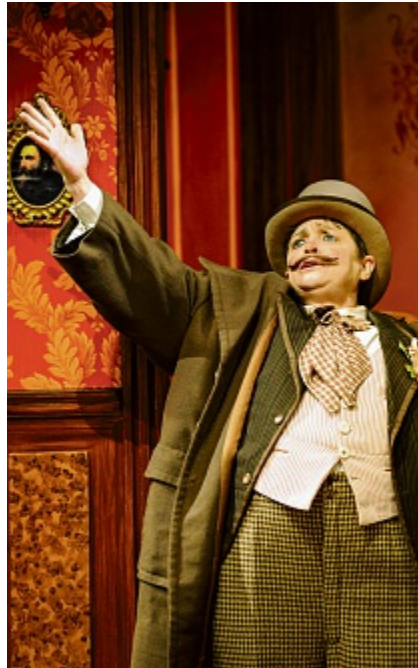
Spielt den Theaterdirektor gleich selber: Regisseurin Katharina Thalbach.

Zum Inhalt: Als Student schrieb Gymnasialprofessor Gollwitz eine Römertragedie. Eine Jugendsünde gewissermassen, die man vergessen darf, wenn da die persönliche Eitelkeit keine Rolle spielen